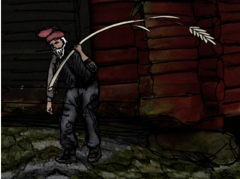
Gårdstomte ,tentoonstelling Skräck och skrock, Falbygdens museum. Gunnar Creutz.(Wikimedia)

duidelijke voorkeuren konden hebben, waardoor het ene paard blaakte van gezondheid en het andere wegwijnde. Als boer en boerin moest je je er voor hoeden bevriend te blijven met de gårdstomte. In Värmland gebeurde het volgende, volgens de volksoverlevering. Een boer zag een kleine man in grauwe kleding zwaar zuchtend het erf opkomen met alleen een strootje in zijn hand. "Dat is wel niets om voor te zuchten", smaalde de boer. Het mannetje sprak beledigd: "Is dat niets om voor te zuchten, dan krijg je ook niets om voor te zuchten." Hij verdween met het strootje en begon daarna graan te stelen op de boerderij. Het liep slecht af met de boer, hoe hard die ook werkte, zijn voorraden bleven klein. Het strootje van de gårdstomte was in werkelijkheid een grote last geweest, maar de zintuigen van de boer hadden hem bedrogen, door toedoen van de kleine helper.