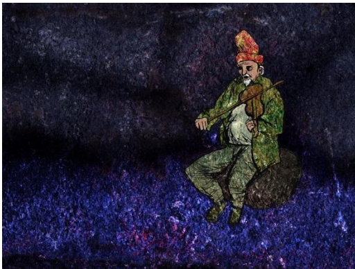
Näcken speelt op zijn viool. Afbeelding van Gunnar Creutz, Falbygdens museum, tentoonstelling Skräck och skrock (Wikimedia)

Op een mooie dag loop je in het bos om bosbessen te plukken, je hoort de mezen kwetteren en de hoge tonen van een paar goudhaantjes. Diep snuif je de warme geur van spar op, terwijl je op je knieën de ronde blauwe bessen met je vingertoppen van de struikjes los maakt. Dan hoor je muziek. Iemand speelt zo prachtig op een viool, dat je wilt zien wie het is en er heen wilt om te luisteren. Je vergeet de bessen, hoort de beek ruisen en boven het geklater uit die polska die je van je leven niet meer vergeet. Onder een smalle houten brug zit hij, Näcken, de vioolspeler, maar als je op de oever plaats neemt om je ogen te sluiten en te genieten, grijpt hij je beet en sleurt je onder water. Gelukkig roep je net voor je onder water verdwijnt "(Christus) kruis". Näckens greep verslapt en hij verdwijnt. Je komt er met een nat pak van af.