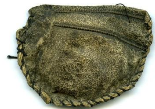
Buideltje tegen Engelse ziekte, uit Broddestorp uit de tweede helft negentiende eeuw. In bezit van Falbygdens museum.

Naast legendes zijn ook waarschuwingen, bezwingingen en rituelen een deel van het Volksgeloof. Pas maar op, als je plast in het gras! Want als je per ongeluk precies een elf of een wezentje van het vättarvolkje (soort aardmannetjes) raakt, kun je niet meer plassen en zwel je op. Slechte gezondheid? Pluk bloemen in de midzomernacht, een nacht waarin de natuur siddert van bovennatuurlijke krachten, en bindt ze tot een krans. Vier feest, maar gooi de krans niet weg. Als het tijd wordt voor het kerstbad, in de langste nacht van het jaar, leg je de bloemenkrans vol krachtige magie in de tobbe en blijf je de rest van de winter verschoond van ziekte en plagen. Andere voorbeelden van magie zijn buideltjes met kruiden of voorwerpen tegen ziekten (zie afbeelding) en het prevelen van spreuken.