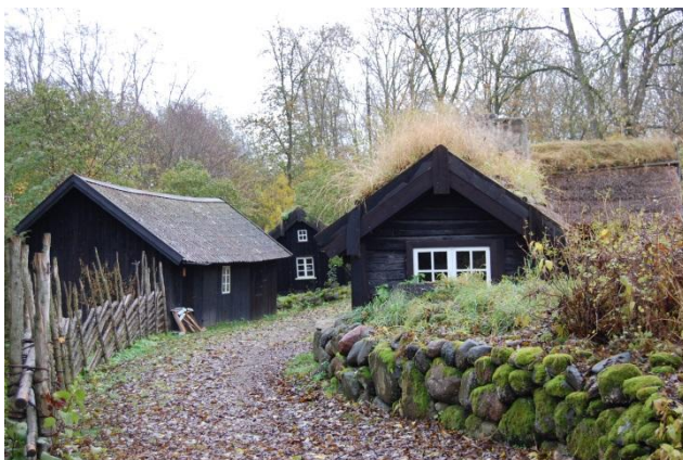
Åsle Tå, Falbygden, foto Marijke Houwink

Door de nabijheid van overweldigende natuur heeft in Zweden het volksgeloof lang voortgeleefd. De bezieling van natuurfenomenen, maar ook angst en onwetenschap leverden vele verhalen op. Iedere plattelandsgemeente of groep boerderijen heeft zijn eigen legendes, over o.a. reuzen, aardmannetjes, dwaallichten, kobolten, watergeesten, bosnimfen en tovervrouwen. Op veel plaatsen klinken soortgelijke verhalen, bijvoorbeeld over wezens die verbonden zijn met watermolens, diepe donkere bosmeren, venen en moerassen, beken, boerenerfen, grotten, steenblokken en prehistorische monumenten zoals hunebedden, steencirkels en rotsen met cupmarks (elfenmolentjes).